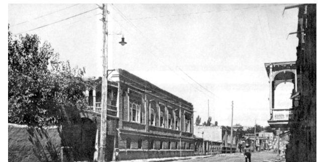
Էլեկտրական լամպ փայտե սյուների վրա, Երևան, Արամի փողոց, 1920 թվական

Ալավերդիում գոյություն ունեցող երկու դիզել գեներատորները նավթի բացակայության պատճառով չեն աշխատել: Այդ պայմաններում պղնձահանքային գործարանը չի աշխատել: