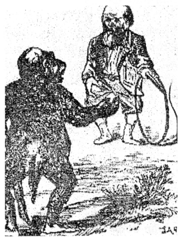
Դարվինը հրավիրում է կապիկին թռչել օդակի միջով:

Ձեր ուշադրությանը ներկայացվող ծաղրանկարները, որ արվել և հրապարակվել են ուղիղ 100 տարի առաջ, դեռ չափազանց մեղմ արտահայտությունն են այն համընդհանուր վրդովմունքի, գայլույթի և շփոթության, որ առաջացրին Դարվինի «Տեսակների ծագումը» գիրքն ու նրա էվոլյուցիոն տեսությունը: