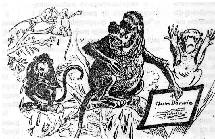
Վիեննական թերթերից մեկում 1882 թվականին տպագրված ծաղրանկարում կապիկները սգում են իրենց բարերար շարլզ Դարվինի մահը... «Դարվինն այլևս չկա, ողբում են կապիկները»- այսուհետ ո՞վ է պաշտպանելու մեր իրավունքները»:

Դարվինը հույս ուներ, որ իր էվոլյուցիոն տեսության բնական ընտրության սկզբունքը դառնալու է ջահ, որ լուսավորելու և բացատրելու է մարդու առաջացման առեղծվածը: Սակայն այդ ջահը, լույս տալու փոխարեն, բոցավառեց վառողի տակառը: Ինքնագոհ ու ինքնահավան բրիտանացիները չէին ուզում հաշտվել ու հավատալ, որ մարդիկ ինչ-որ ժամանակ ուրիշ տեսք ու կերպարանք են ունեցել, և որ նեանդերթալյան մարդը եղել է իրենց նախնին (ի դեպ, նեանդերթալյան մարդու կմախքը հայտնաբերվել է հենց այդ ժամանակ):