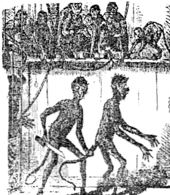
1876 թվականին հրապարակված ծաղրանկարում կապիկը խնդրում է ընկերուհուն, կտրել իր պոչը: Նա շտապում է օր առաջ մարդ դառնալ:

Ի դեպ, էվոլյուցիոն տեսության շուրջ վեճերը շարունակվում են նաև այսօր. 1972 թվականին կրթության գործերով Կալիֆոռնիական խորհրդում բռնում վեճեր առաջացրեց այն պահանջը, որ երեխաներին պետք է ծանոթացնել ոչ միայն