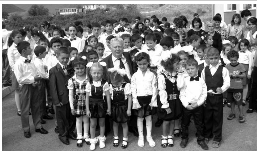
Ակադեմիկոս Ռադիկ Մարտիրոսյանը Արցախի Մարտակերտի շրջանի հայրենի Մատաղիս գյուղի, իր անունը կրող դպրոցի աշակերտների հետ:

Խորը ու հիմնարար պատրաստություն ստանալով՝ նա հենց Մոսկվայում կատարել է մի շարք գիտական ուշագրավ հետազոտություններ և դարձել ռադիոաստղագիտության բնագավառում քվանտային ուժեղարարների կիրառման առաջամարտիկներից մեկը: Նրա կողմից մշակված 21սմ ալիքի երկարություն ունեցող