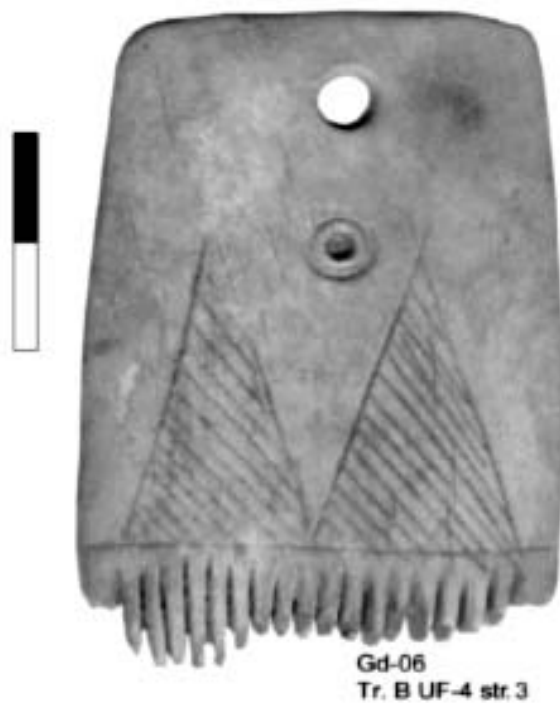
Գոդեծոր: Ոսկրե գործիք մ.թ.ա. IV հազ. կես

Գոդեծորից հայտնաբերված ոսկրե և կավե գործիք-