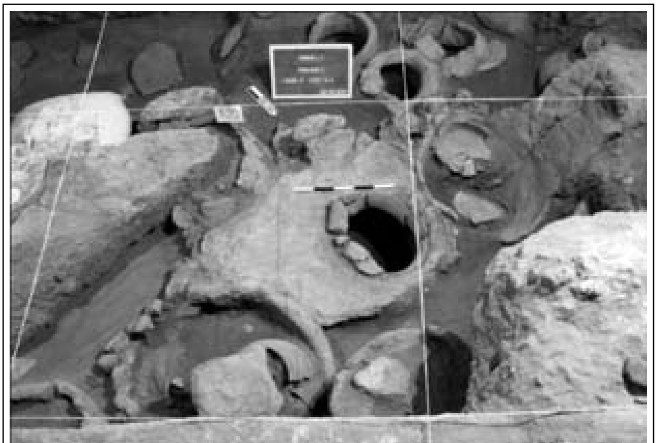
Արենի 1: Գինու արտադրական համալիր մ.թ.ա. IV հազ. սկիզբ