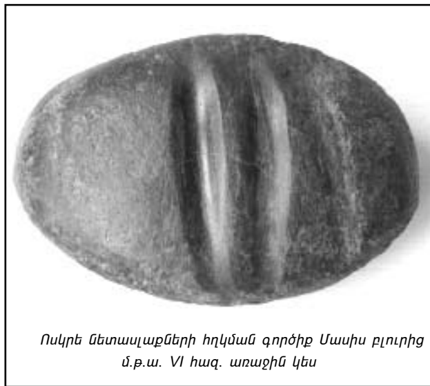
Ոսկրե նետասլաքների հղկման գործիք Մասիս բլուրից մ.թ.ա. VI հազ. առաջին կես

վերանայելու տարածաշրջանի մշակութային և բնական լանդշաֆտի մասին նախկինում տիրապետող բազմաթիվ տեսակետներ, վեր հանել հնագույն հանրությունների և բնական միջավայրի «փոխհարաբերության» իրական պատկերը՝ հնագիտական տարբեր փուլերի ու «մշակույթների» համար: Երրորդ կարևոր հանգամանքն այն է, որ սկզբունքորեն և որակապես նոր տվյալներով համալրված հնագիտական սկզբնաղբյուրներն այսօր լեռնաշխարհի հնագույն և հին հասարակությունների «դիմագիծն» արտացոլող սոցիալ-մշակութային միջավայրում նկատվող ձևափոխությունների բնութագրության, մեկնաբանության նոր հայեցակարգերի, նոր տեսակետների պահանջ են դնում: