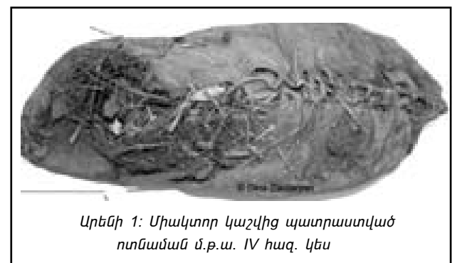
Արենի 1: Միակտոր կաշվից պատրաստված ոտնաման մ.թ.ա. IV հազ. կես

Վաղ երկրագործական հասարակությունների հասարակական և տնտեսական կենցաղի, պատկերացումնե-