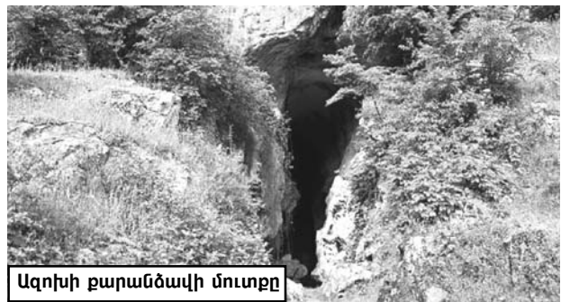
Ազդիսի քարանձավի մուտքը

* Ռ. Զարյան, «Հուշապատում», գիրք առաջին, 1975 թ.