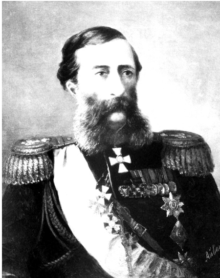
Միքայել Լոռիս Մելիքով, Ռուսաստանի վարչապետ և դիկտատոր:

3. Ֆաթիմյան խալիֆայություն: Բաղր Գամալ ալ-Արմանին: Ֆաթիմյան խալիֆայությունը պատմության մեջ հայտնվեց 909 թ., որը ստացավ Ֆաթիմյան անվանակոչումը Մուհամմադ մարգարեի դստեր Ֆաթիմայի անունից: Ֆաթիմյան խալիֆայությունը հաստատվեց Յուսիսային Աֆրիկայում և նրա կենտրոնը դարձավ Եգիպտոսը: Նրան միացվեցին Իֆրիկիայան, Ալժիրը, Մադրիդը, Սիրիան, Արաբիան, Իրաքի որոշ շրջաններ, Չիբազը Մեքքայով և Մադինայով: Դա դարձավ մի կայսրություն, որը ձգվում էր Ատլանտյան օվկիանոսից մինչև Կարմիր ծով: Ֆաթիմյան խալիֆաները խա-