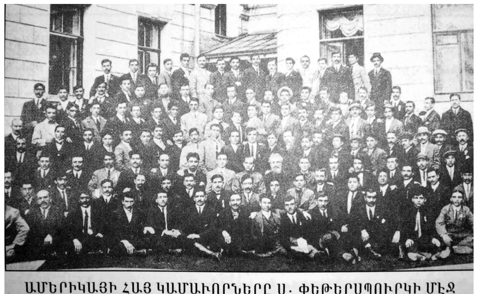
ԱՄԵՐԻԿԱՅԻ ՀԱՅ ԿԱՄԱՌԱՌՐՆԵՐԸ Ս. ՓԵԹԵՐՍՊՈՒՐԿԻ ՄԵՋ

Նյու Յորքում բացված Հայկական համաշխարհային կոնգրեսում, որին մասնակցում էին տարբեր համայնքների հասարակական-քաղաքական հոսանքների ու կազմակերպությունների ներկայացուցիչներ: Նրանք, քննարկվելով ներգաղթի և Հայաստանի վերաշինության շուրջ բոլոր հայ համայնքների միջև միության և համերաշխ գործակցության հաստատման հարցը, որոշել են զորացնել համայնքների և Մայր Հայրենիքի միջև հոգևոր-մշակութային կապը, միջազգային ասպարեզում հասարակական կարծիք ձևավորել հայկական հողային պահանջների արդարացիության նկատմամբ՝ հարցի քաղաքական լուծումը վերապահելով Միավորված ազգերի կազմակերպությանը: Հայկական համաշխարհային կոնգրեսի ավարտին Նյու Յորքում