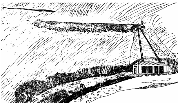
Երևանի «Ամպեր» ընկերության հիդրոէլեկտրակայան, 1907թ.

Երևանի էներգետիկայի վիճակը վատացավ հատկապես շուկայական տնտեսավարության անցման պայմաններում, որը ժողովրդի հիշողության մեջ մտավ որպես «ցրտի և մթի տարիներ»: