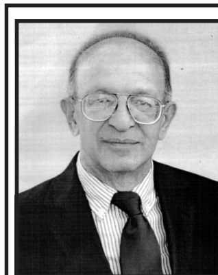
Գեո, գիտքարտուղար և տնօրեն:

ՀՀ ԳԱԱ տեղեկատվական-վերլուծական ծառայություն