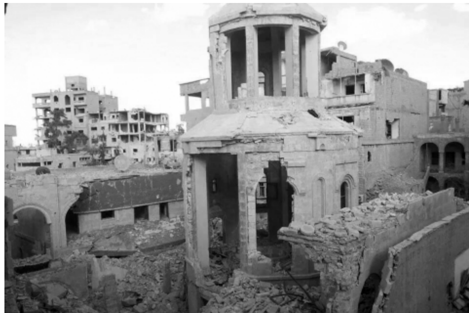
Դեր Ջորի Սթրոգ Մահատակաց հայկական եկեղեցին պայթեցված իսլամիստ ահաբեկիչների կողմից (2014 թ., սեպտեմբերի 21-ին՝ ամսաթիվը պատահական չէ ընտրված, Հայաստանի երրորդ Հանրապետության անկախության հռչակման օրը)

հարաբերություններում գլխավոր խոչընդոտ հանդիսացող ՍՄՀՄ-ի փլուզումից քառորդ դար անց, այժմ արդեն որպես նոր խոչընդոտներ են դիտարկվում (ընդ որում, հիմնականում նույն այդ ուժերի իսկ կողմից) Հայաստանի սոցիալ-տնտեսական դժվարությունները, քաղաքական դրությունը Արցախում, արևելահայ լեզվամտածողության, ինչպես նաև ռուսերենի գործածության առանձնահատկությունները և այլն: