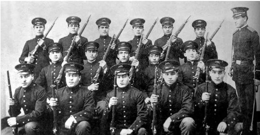
Ամերիկահայ կամավորներին մարզող «Հրայր» խումբը, Բոստոն

դամության, հետդարձի և այլ նյութական ծախսերի հետ: Ազգային բյուրոն Բոստոնի կենտրոնական կոմիտեի միջոցով վճարել էր միայն 430 ամերիկահայ կամավորի վերադարձի ճանապարհածախսը՝ ընդհանուր 60.600 ռուբլի արժեքով, ինչպես նաև նվիրատվություններից ու կազմակերպված տարբեր վաճառահանումներից ստացված գումարով սահմանել նպաստ զոհված կամավորների ընտանիքներին և այլն: