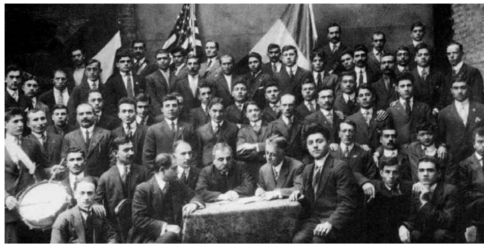
Կովկասյան կամավորական շարժմանը մեկնելու պատրաստ ամերիկահայերը Նյու Յորքում

Գրաված տարածքները ռուսական բանակին հանձնելուց և կարճատև վերականգնողական դադարից հետո հերոսական գունդը գրավել է Ալպեղա, Ճանապող, Չար, Դալեկ գյուղերը: Այնպես որ մինչև նոյեմբերի 9-ը Բասենի դաշտն ամբողջ-