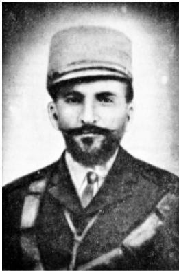
ՊԵՏՐՈՍ ՏԵՐԱԿԵՐԵՆՆԻ 1915ի հերոսամարտի զինվորամասի

Սեպտեմբերի 5-ին Միջերկրական ծովի խորքով անցնող ֆրանսիական «Կիչեն» ռազմանավը նկատում և դանդաղեցնում է ընթացքը: Յոթ օր հետո ֆրանսիական «ժամնա դ'Արկ» շոգենավը անգլիական ռազմանավերի ուղեկցությամբ մոտենում է Մուսա լեռան և ավելի քան 4.200 մուսալեռցիների փոխադրում է Պորտ Սայիդ, որտեղ նրանք Պողոս Նուբարի հիմնադրած ՀԲԸՄ-ի աջակցությամբ պատսպարվում են վրանաքաղաքում: